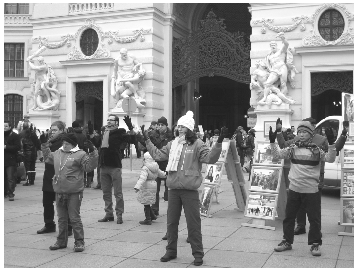
Vorführung der Übungen von Falun Dafa auf dem Michaelerplatz, bestaunt von tausenden Touristen. Eine Fotoausstellung dokumentiert die Verbreitung von Falun Dafa, die Anmut dieser Qigong-Schule sowie die absurde Verfolgung in der Volksrepublik China.

„Ist Falun Dafa aber auch sicher keine Sekte?“, überlegte ein Passant, der sich für Menschenrechte engagiert. Als er von den Grundsätzen Wahrhaftigkeit, Barmherzigkeit und Nachsicht erfuhr, schob er diese Sorge beiseite und wendete sich konzentriert dem Tisch mit Informationsmaterialien zu. Ein Yoga-Lehrer meinte: „Ich kann eigentlich alles unterschreiben, was ich hier über Falun Gong höre“, und setzte seine Unterschrift dann auch auf unsere Petitionsliste. Diesem Aufruf an die