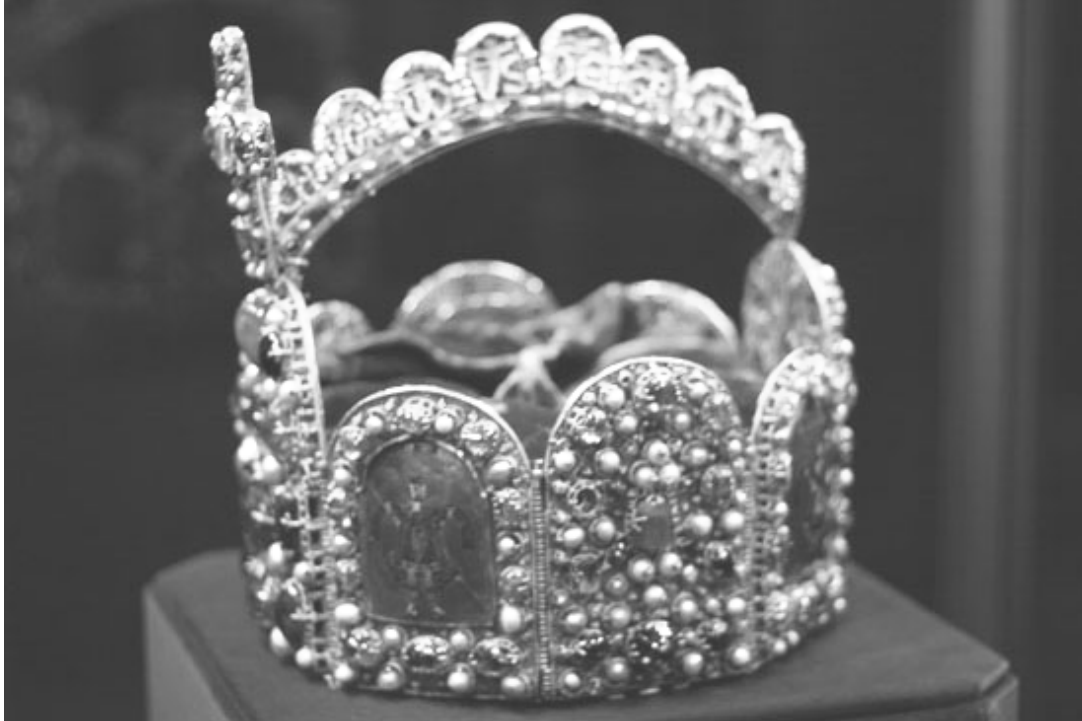
Die Reichskrone: Zur Zeit der Tang-Dynastie musste auch ein Prinz sich nach Moral und Tugend richten.